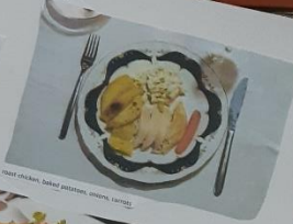
roast chicken, baked potatoes, onions, carrots