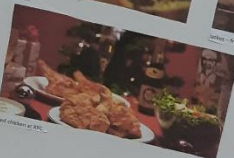
roast chicken w. potatoes