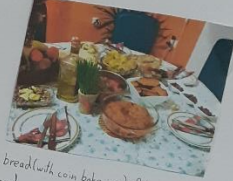
bread (with coin baked in), fish, baked beans and onions, potato salad