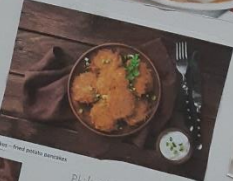
roast - fried potato potatoes