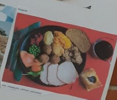
roast potatoes, carrots, cranberry