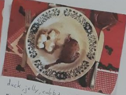
duck, jelly, cabbage rolls with minced pork