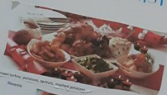
roast turkey, potatoes, spinach, mashed potatoes